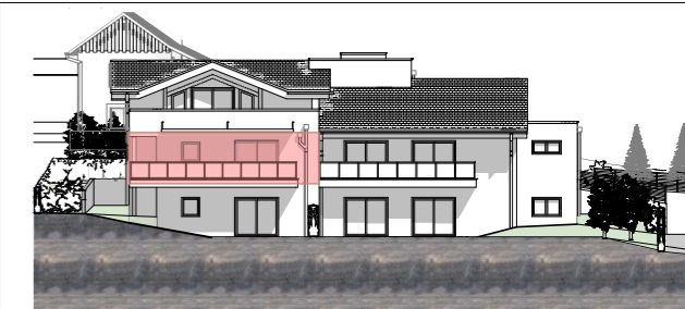
Plan façade SUD